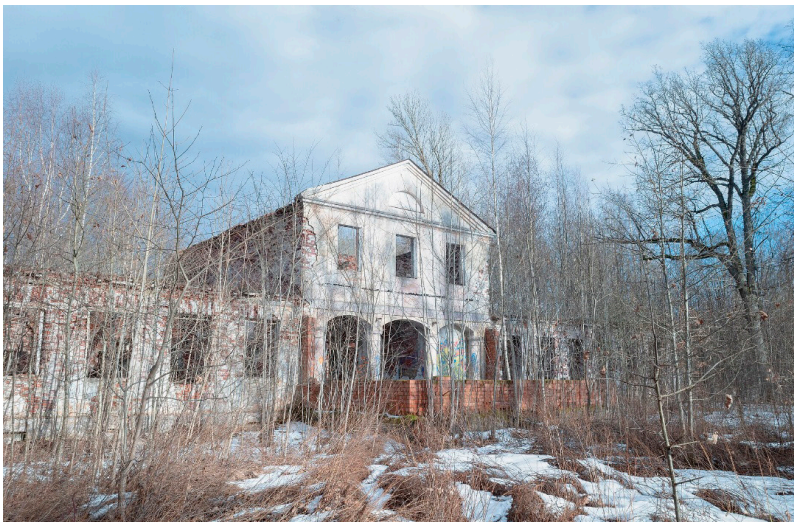
Sauga mõis 2021. aastal.