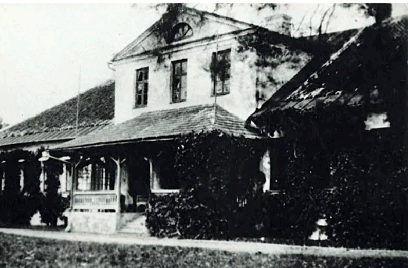
Sauga mõisa peahoone enne II maailmasõda.

Sauga mõisa hilisklassitsistlik peahoone, mis ehitati 1849. aastal, oli valdava osa 20. sajandist sõjaväebaas. Peale taasiseseisvumist jäi mõis tühjaks ja rüüstamise tagajärjel varemetesse. Praegu kuulub see Pärnu linnale.