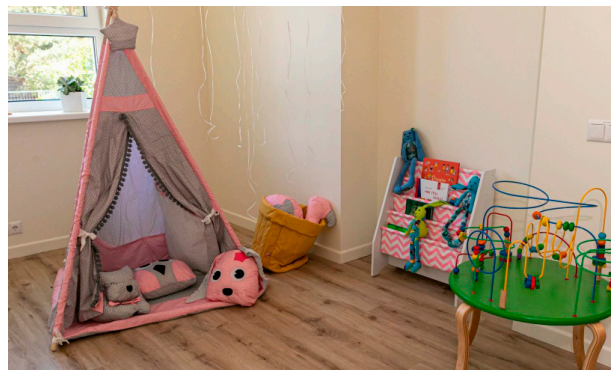
Tallinna lastekodu, 2022