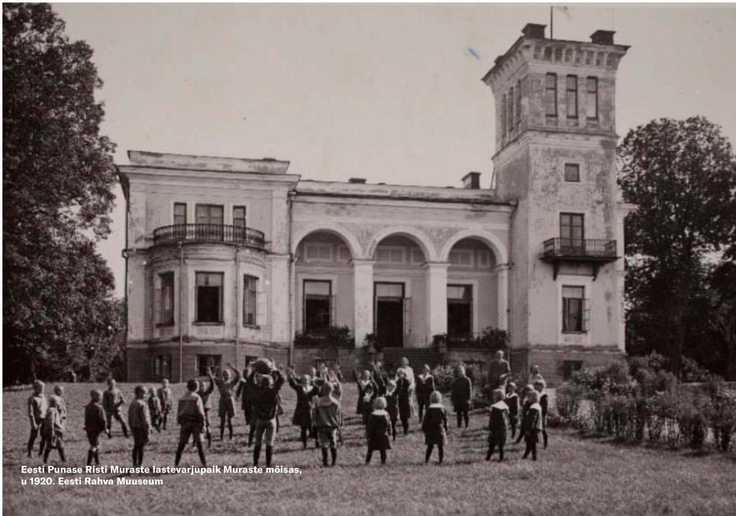
Eesti Punase Risti Muraste lastevärvajapaik Muraste mõisas, u 1920.